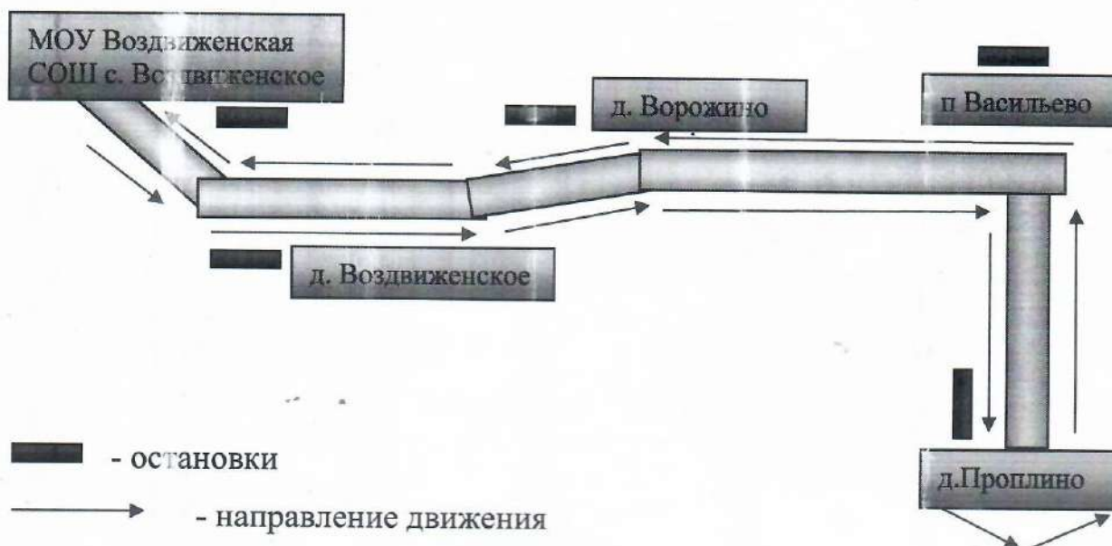
Схема Маршрута № 2: с.Воздвиженское – д.Ворожино – д.Васильево – д.Проплино – д.Васильево – д.Ворожино – с. Воздвиженское

3) Остановки школьных автобусов осуществляются в установленных маршрутом местах, исключают необходимость перехода обучающимися